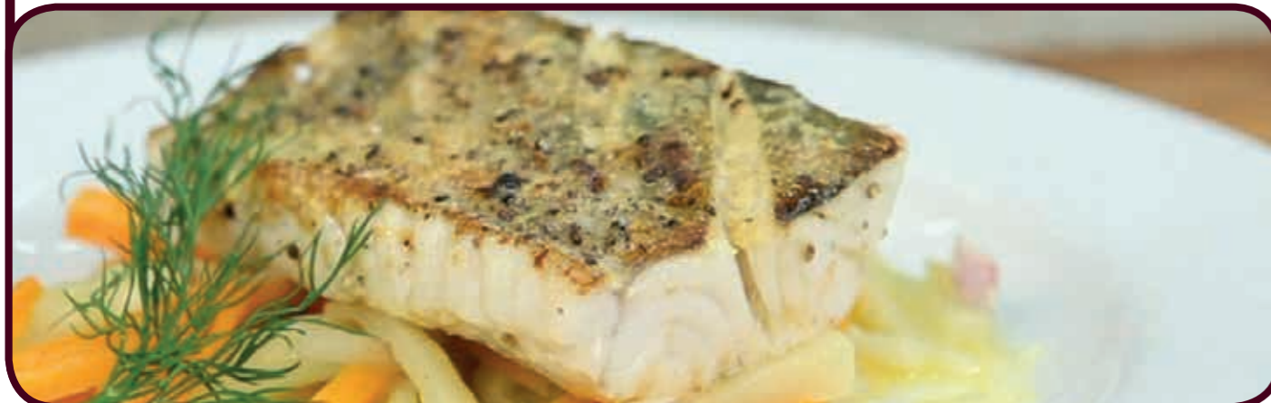
Alle Preise inkl. Mehrwertsteuer und Bedienung. Die Liste mit den Kennzeichnungen finden Sie am Tresen