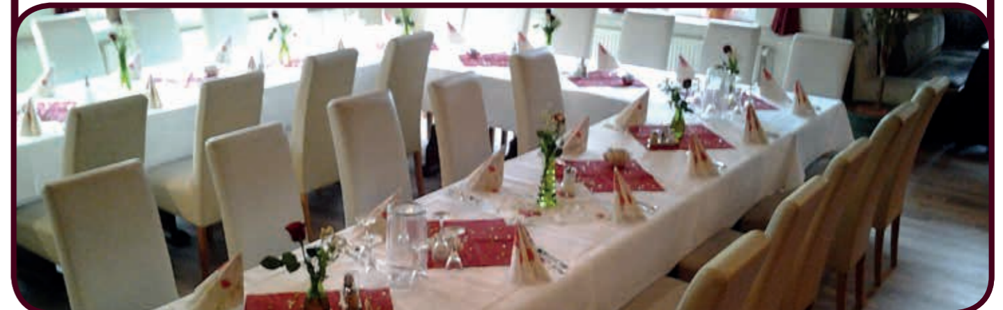
Alle Preise inkl. Mehrwertsteuer und Bedienung. Die Liste mit den Kennzeichnungen finden Sie am Tresen

1) mit Farbstoff • 2) mit Konservierungsstoff • 3) mit Antioxidationsmitteln • 4) mit Geschmacksverstärker 5) mit Schwefeldioxid • 6) chininhaltig • 7) mit Phosphat • 8) mit Milcheiweiß • 9) koffeinhaltig • 10) chininhaltig 11) mit Süßungsmitteln • 12) enthält Phenylalaminquelle