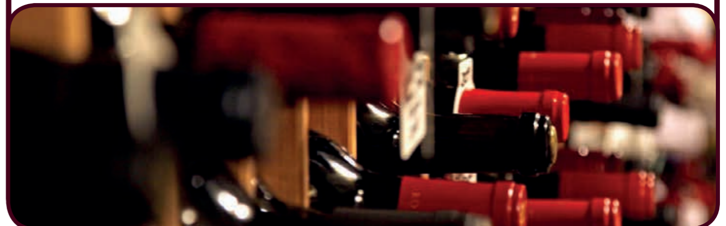
Alle Preise inkl. Mehrwertsteuer und Bedienung. Die Liste mit den Kennzeichnungen finden Sie am Tresen