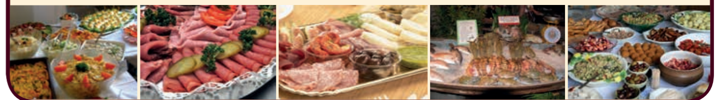
Alle Preise inkl. Mehrwertsteuer und Bedienung. Die Liste mit den Kennzeichnungen finden Sie am Tresen

Wir liefern Ihnen ein Kalt-Warmes Buffet für 10 Personen ab 170,00 €