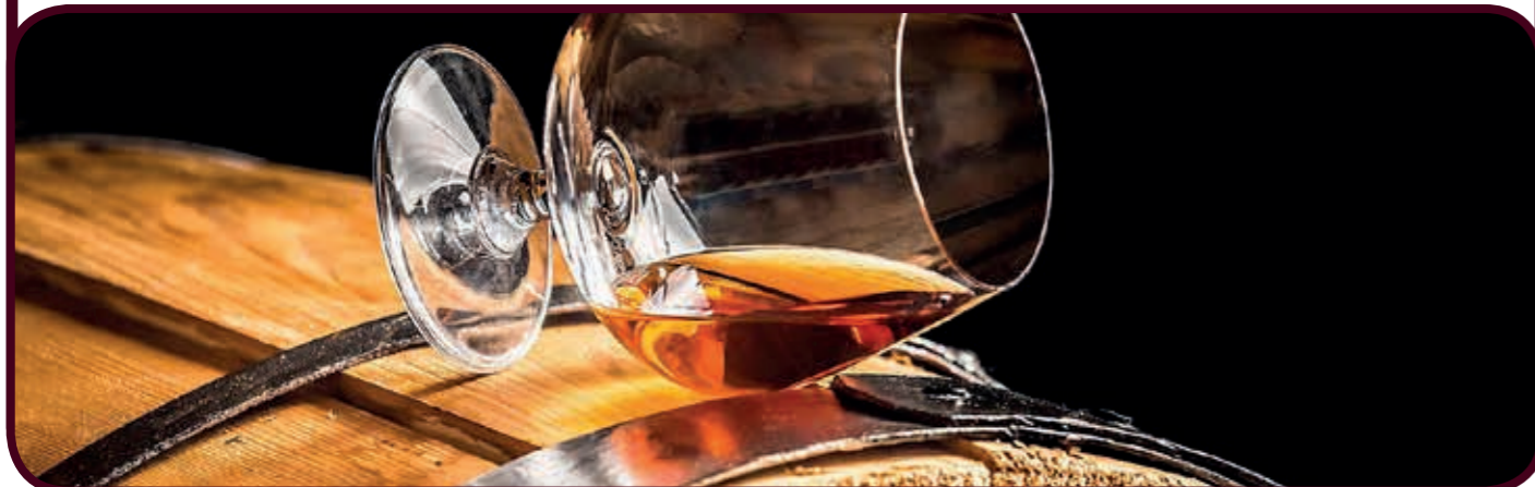
Alle Preise inkl. Mehrwertsteuer und Bedienung. Die Liste mit den Kennzeichnungen finden Sie am Tresen